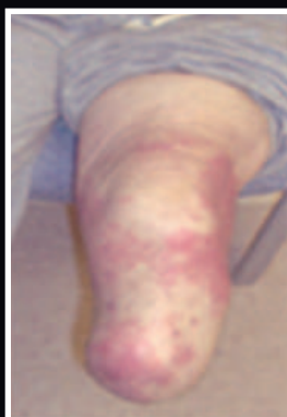
Vor der ersten Anprobe mit dem EasyLiner®.